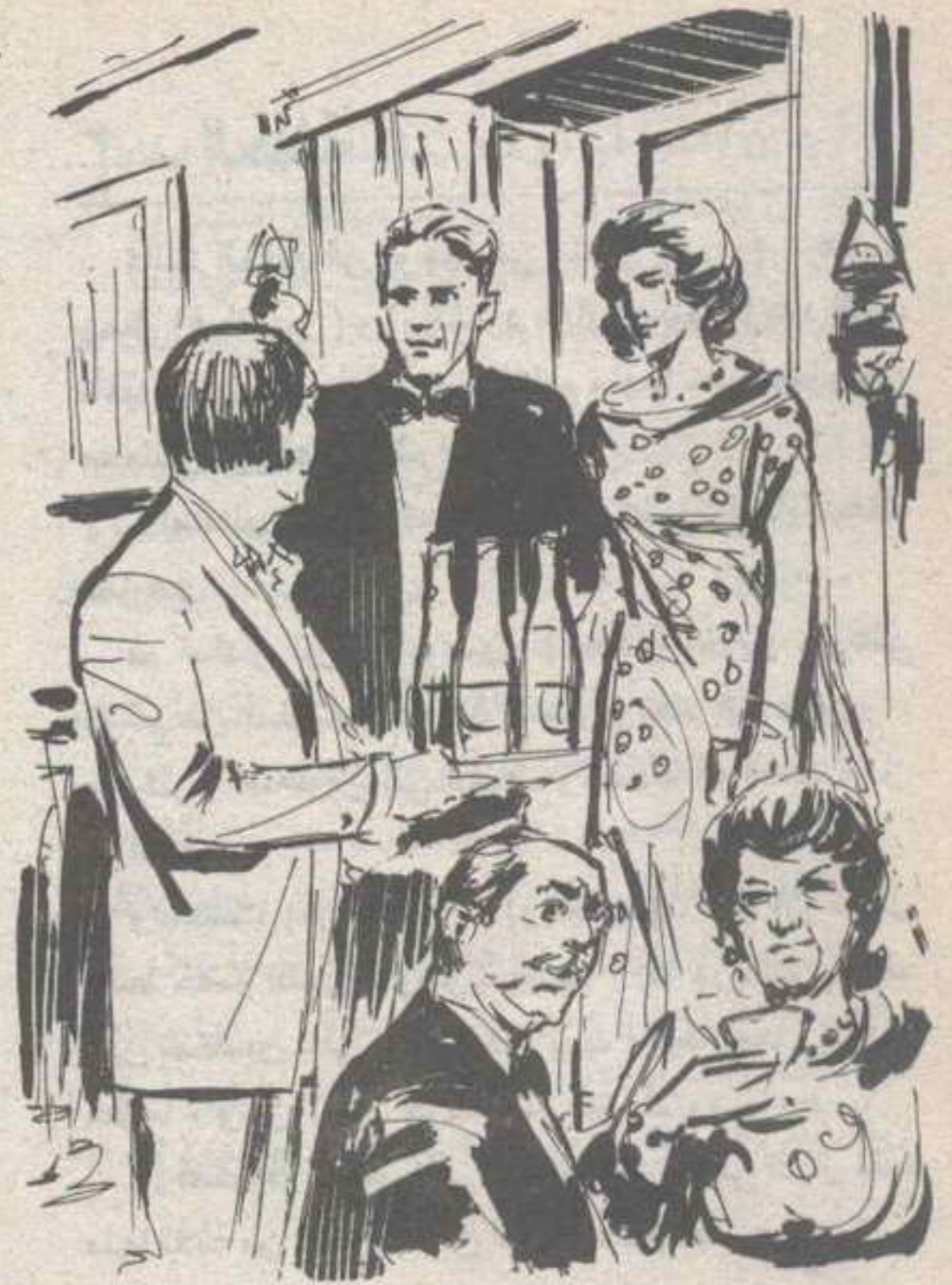
تقدم منهما مضيفهما ويداه محملتان بزجاجات الشراب ..

كان المتكلم طويلاً ووسيماً بشكل ملحوظ ، وفي وجهه ندبتان ، واحدة في الصدغ ، والأخرى في الذقن ، من أثر جروح قديمة ، مما أعطى وجهه الأشقر صفة خاصة ، وقال وهو يبتسم :