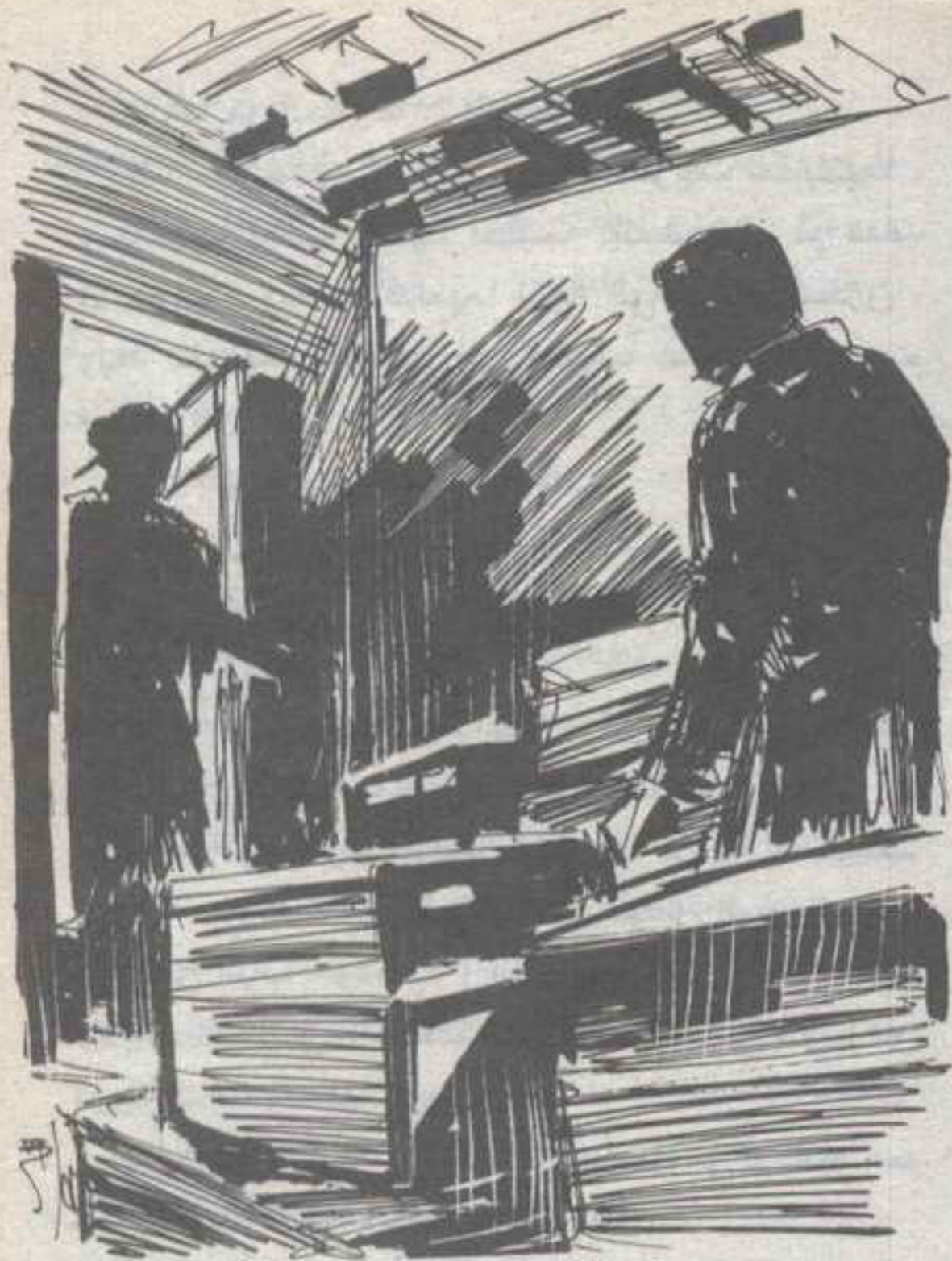
وسمع وقع أقدام (آلى) تقترب، وفتح الباب فى الحجره المتوسطة، ووقفت (آلى) تنظر فى الضوء الخافت ..

فى (انزبروك) ، الذى يرن عندما تفتح أو تغلق الباب ، وسمع وقع أقدام ( آلى ) تقترب ، وفتح الباب فى الحجره المتوسطة ، ووقفت ( آلى ) تنظر فى الضوء الخافت ، وخرج من وراء الصناديق ، فقالت : - الحمد لله .