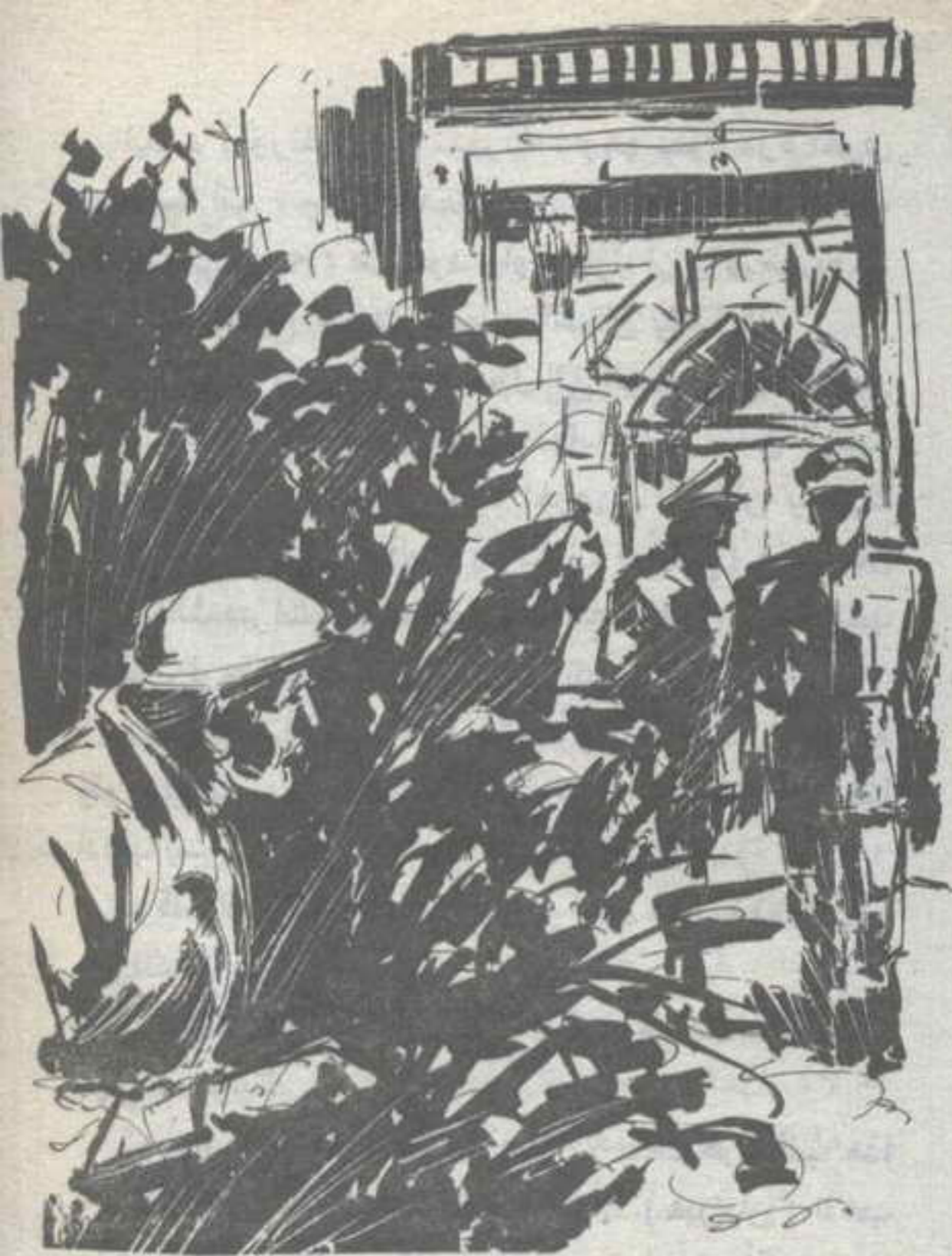
وسار (ريتشارد) بسرعة نحو التليفون، ورفع السماعة،