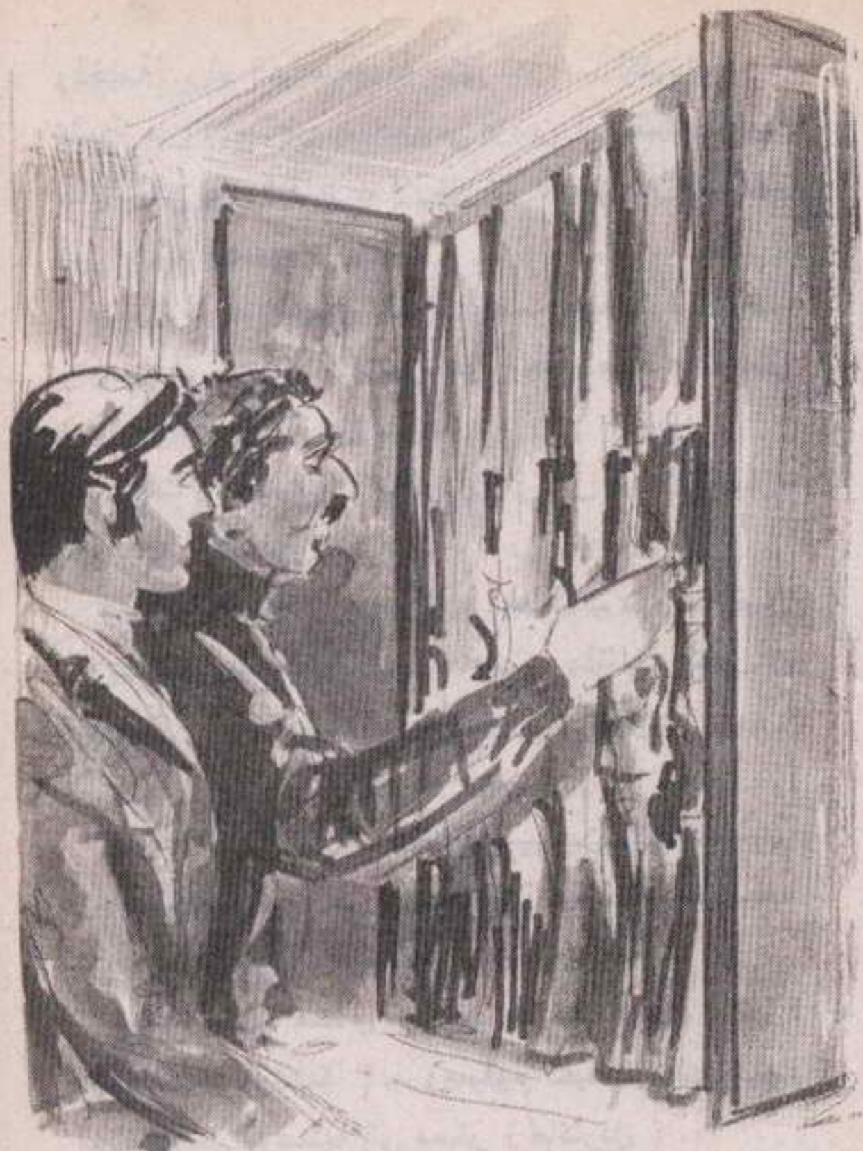
وقادنى إلى خزانة من خشب البلوط ليرينى صفوفا من البنادق متراصة بدقة كأنابيب الأرغن ..

- « يا إلهى الرحيم !.. إلى هذا الحد من السوء أنت ؟.. يجب أن تحسن الرماية فى أمريكا الجنوبية إذا لم يكن البروفسور ( تشالنجر ) كاذباً أو مجنوناً .. فهذا يعنى أننا سنرى وحوشاً مذهلة .. »