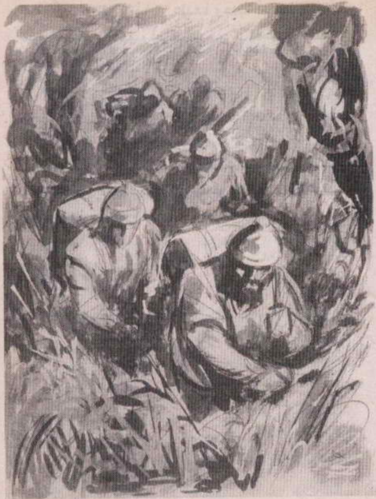
وصرنا نشق دربنا باستعمال المديّ ! ..

- « هذه هي علامة الطريق .. إن الممر السري يبعد نصف ميل عن هنا .. إن بوابة المجهول تنتظر أن نوغل فيها .. »