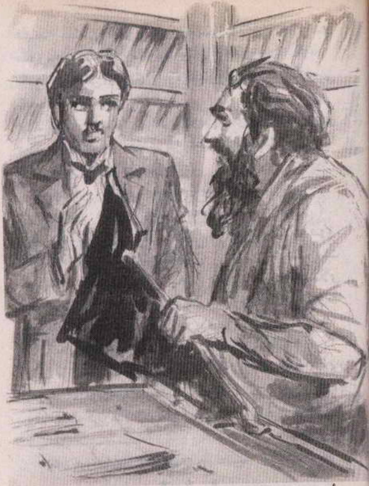
وأخرج من درج مكتبه ما بدا لي كجزء أعلى من جناح وظواط عملاق ..

وأخرج من درج مكتبه ما بدا لي كجزء أعلى من جناح وظواط عملاق .. كان طوله قدمين وله غلاف غشائي ..