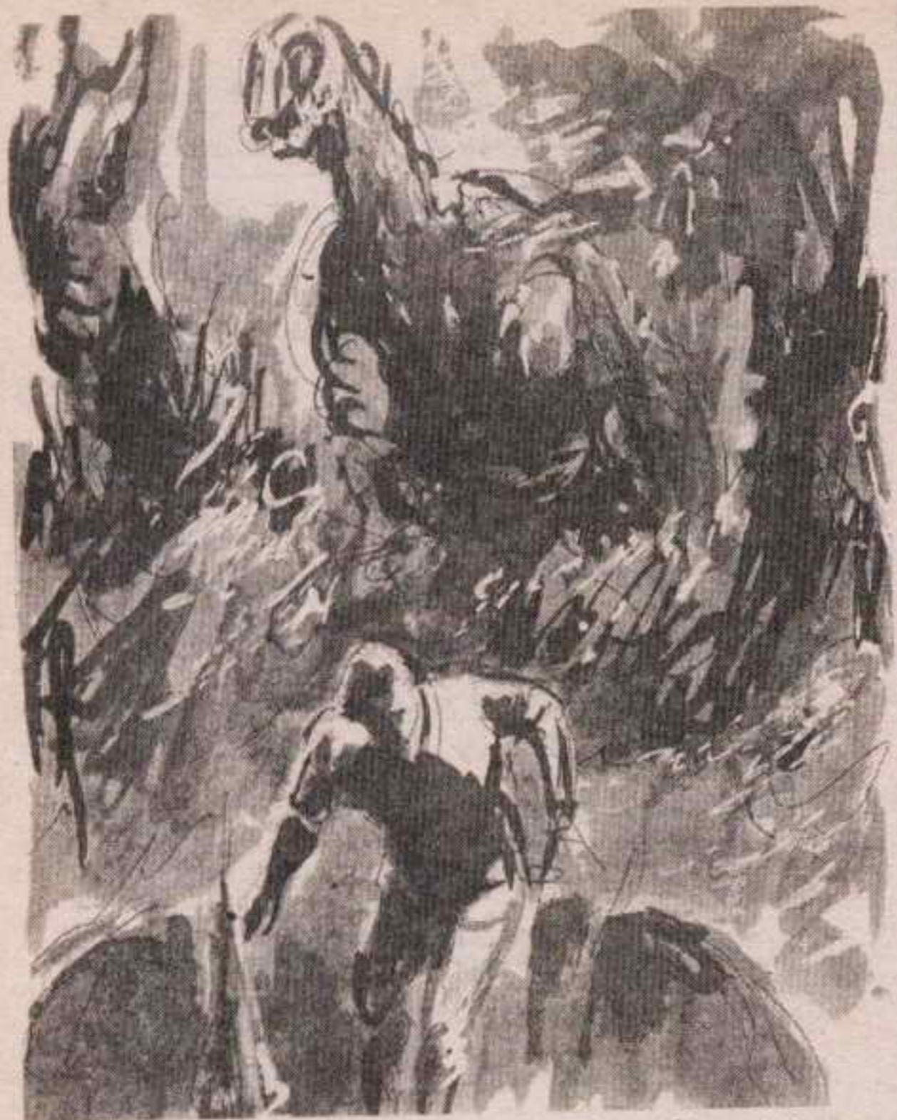
وهنا مادد الأرض تحت قدمي .. وشعرت أنني أهوى تحت مستوى الأرض ..