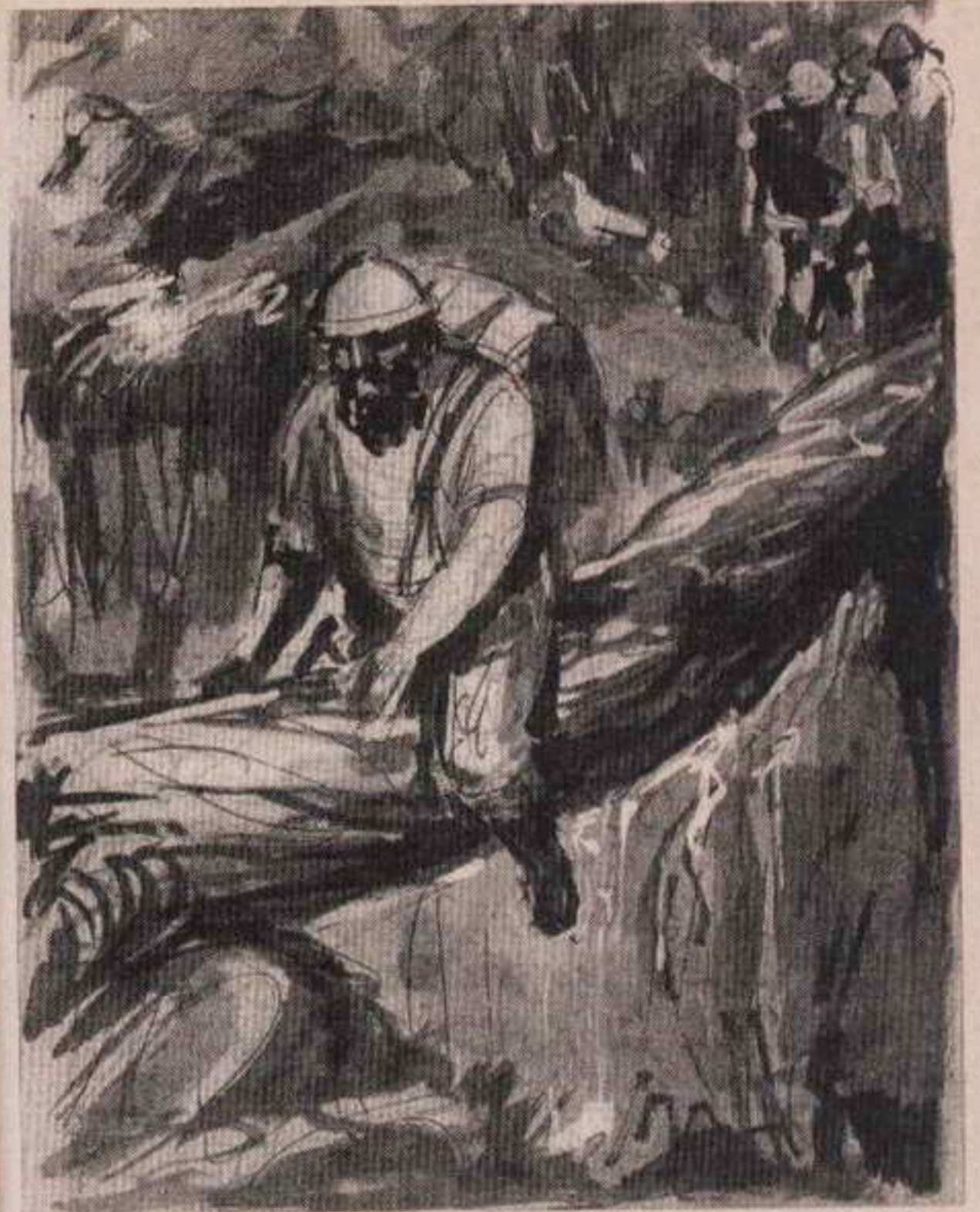
وبعد اتخاذ الاحتياطات عبر ( تشالنجر ) الهاوية وقد امتطى الجذع كأنه ظهر حصان ..