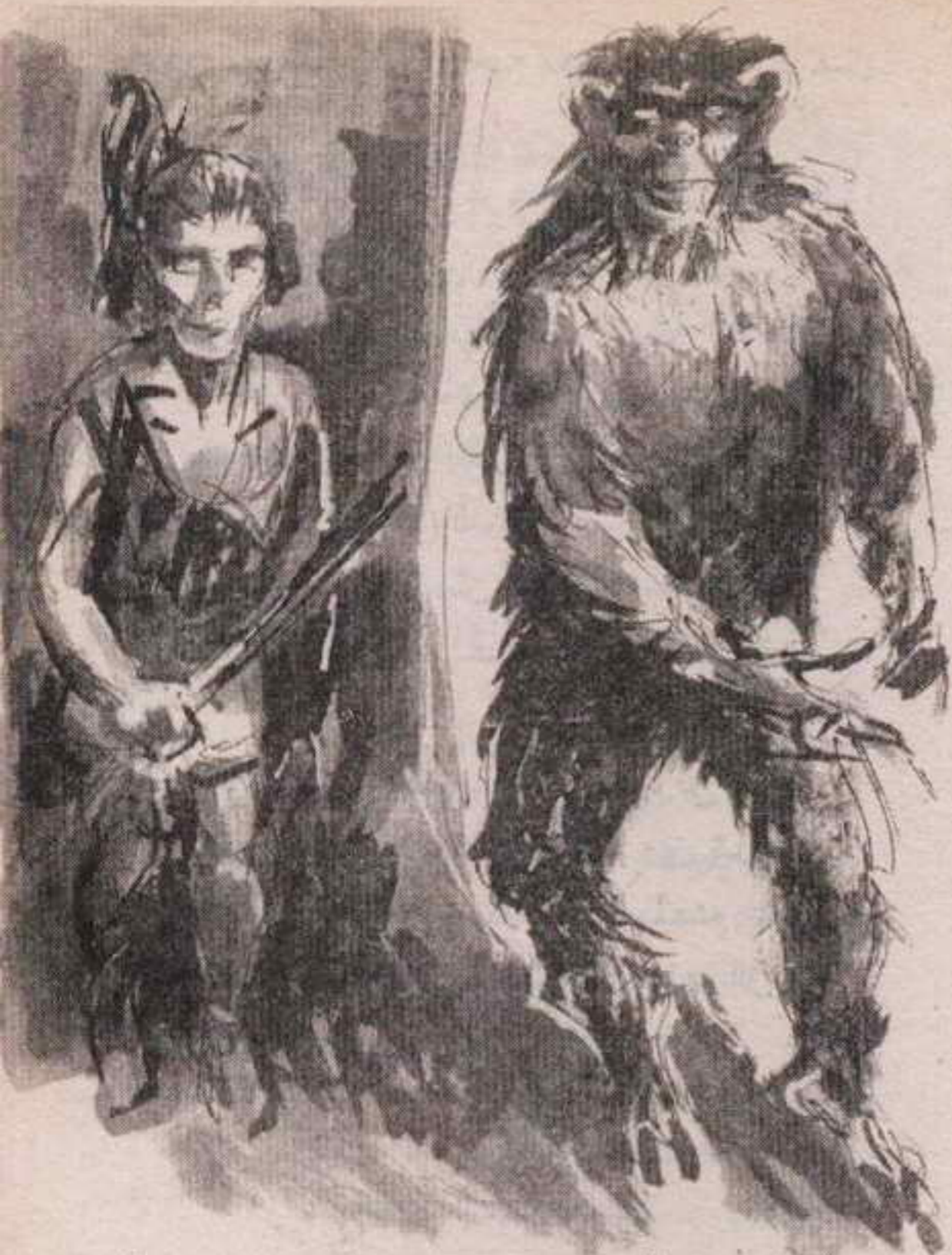
كان القروود أقوياء .. وكان الواحد منهم يقتل هنديًا أو اثنين قبل أن يهلك ..