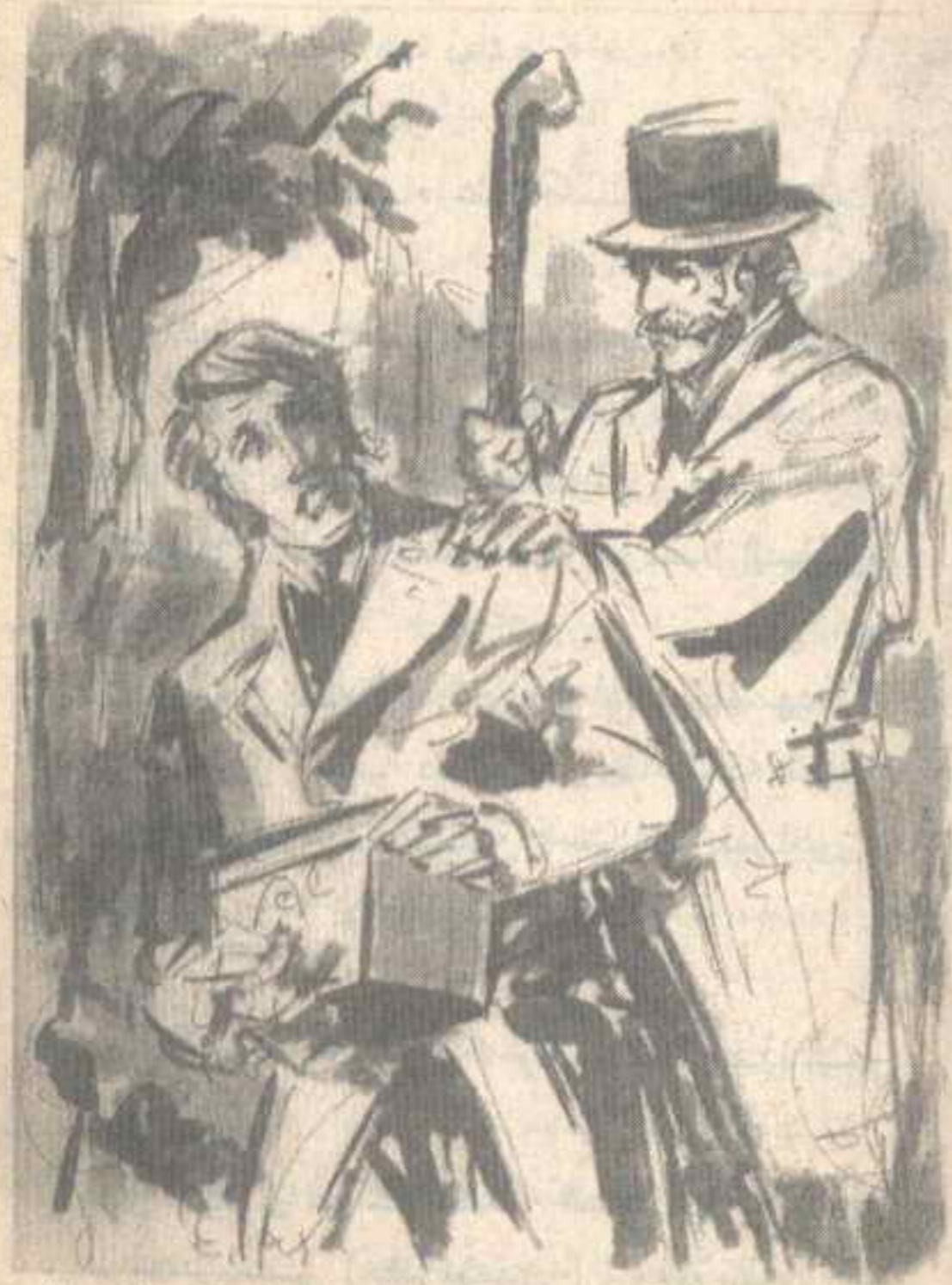
مشى أسرع من المعتاد حتى كاد يعبر حدائق ( كنزنجتون ) حين وجد نفسه فجأة أمام الجنرال ! ..