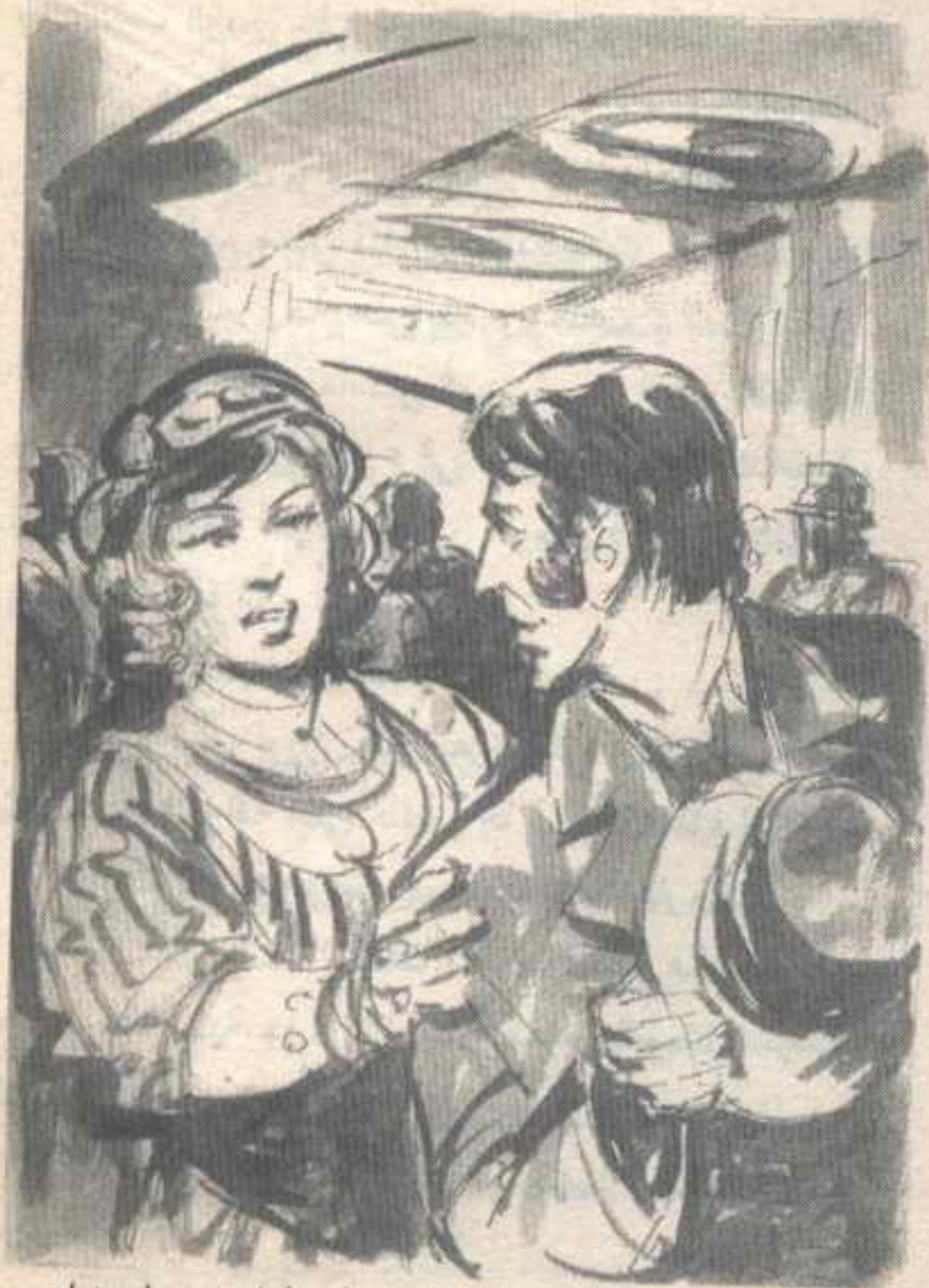
اتجه للخروج حين شعر بيد توضع على ذراعه .. استدار فرأى امرأة ضخمة الحجم ، لكن وجهها وديع ..

- « غداً عليك أن تبقى في حجرتك لا تغادرها .. ولو جاء من يزورك من رفاقك فلتصرفه فوراً .. ثم - في الحادية عشرة إلا الربع - تفارق الفندق .. لا تتكلم مع البواب وإلا أفسدت كل شيء .. توجه إلى تقاطع حدائق ( لوكسمبورج ) مع الـ ( بوليفار ) وسأكون بانتظارك هناك .. عليك أن تتبع تعليماتي حرفياً ،