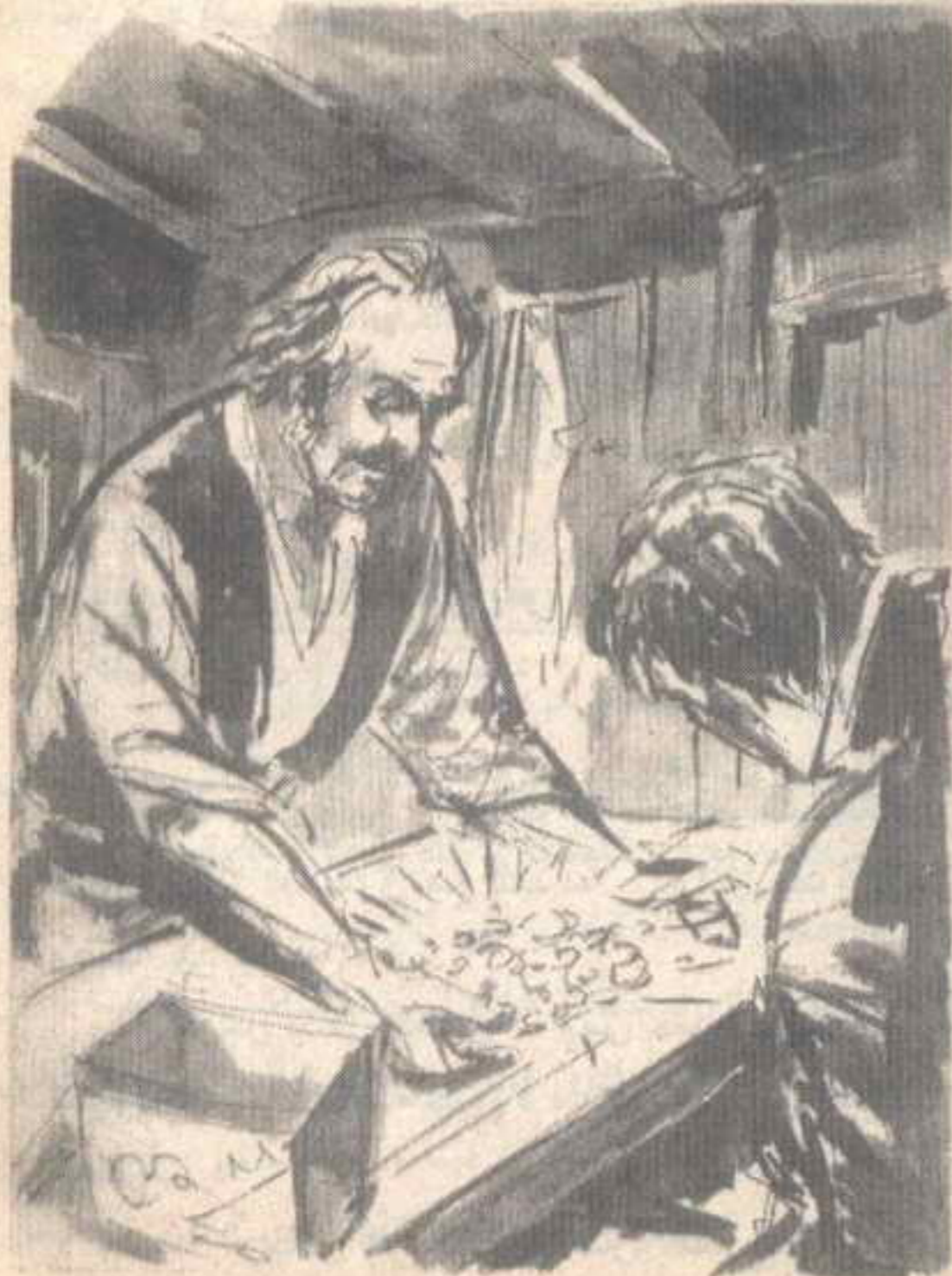
وأثار وجهه الذي اجتاحتته الشهوات الذعر في