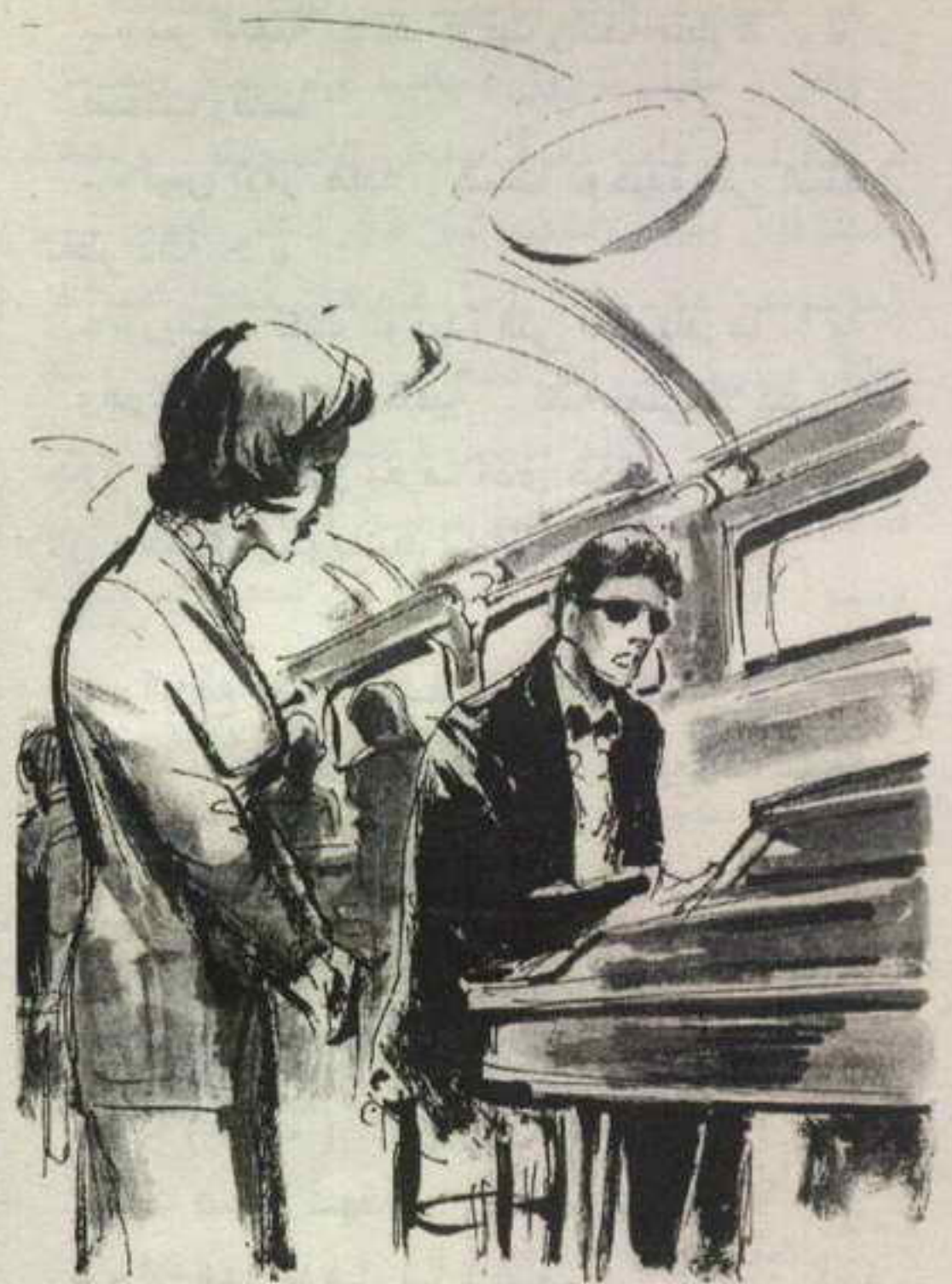
هنا كف عن العزف للحفل ، وراح يعزف لشخص واحد فقط ..