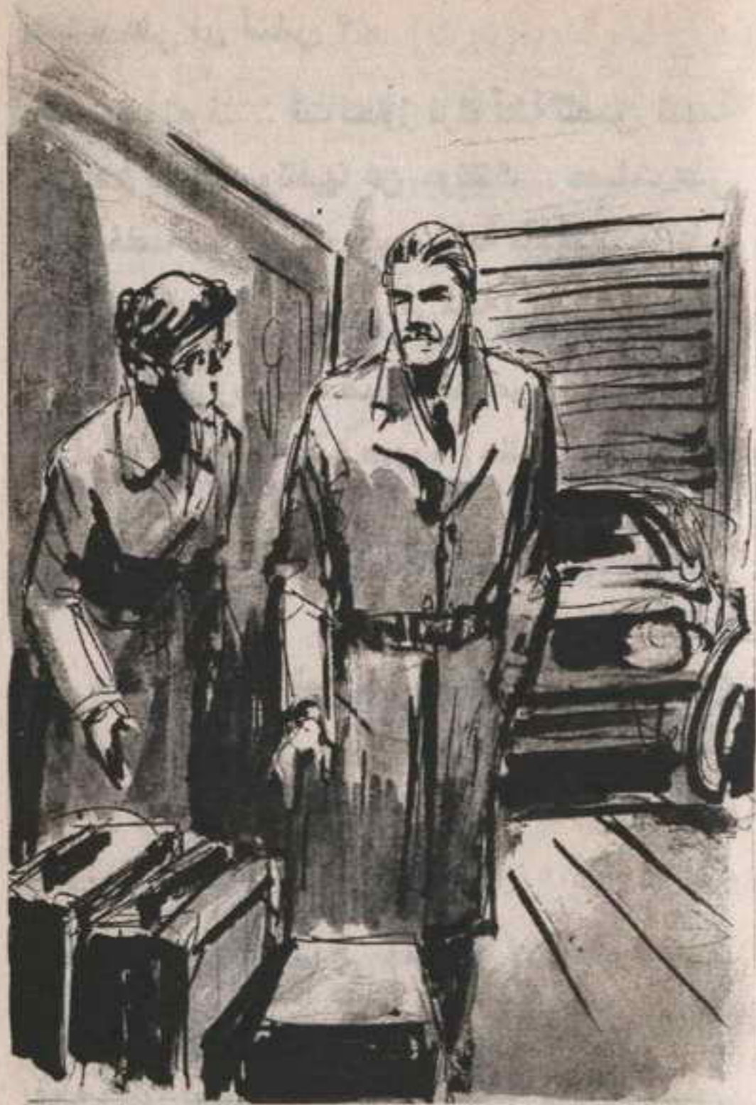
كانت هناك حقيبتان قديمتان على الأرض ، وصندوق قديم .. كان الصندوق مغلقًا ، وأدرك (ميسون) أنه بحاجة إلى أمر تفتيش كي يفتحه ..

بالسرقة .. وقد قرر أن يدخل الجراج بسيارته ، حتى لا تلفت الأنظار خارج المكان ..