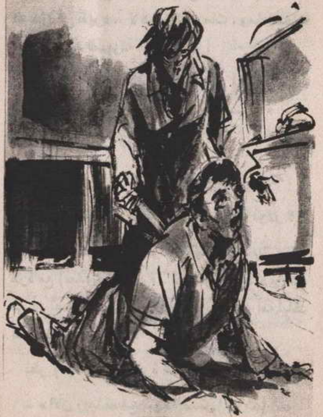
انقض على لكنه تعثر ، وفي اللحظة ذاتها أغمدت السكين في ظهره ..