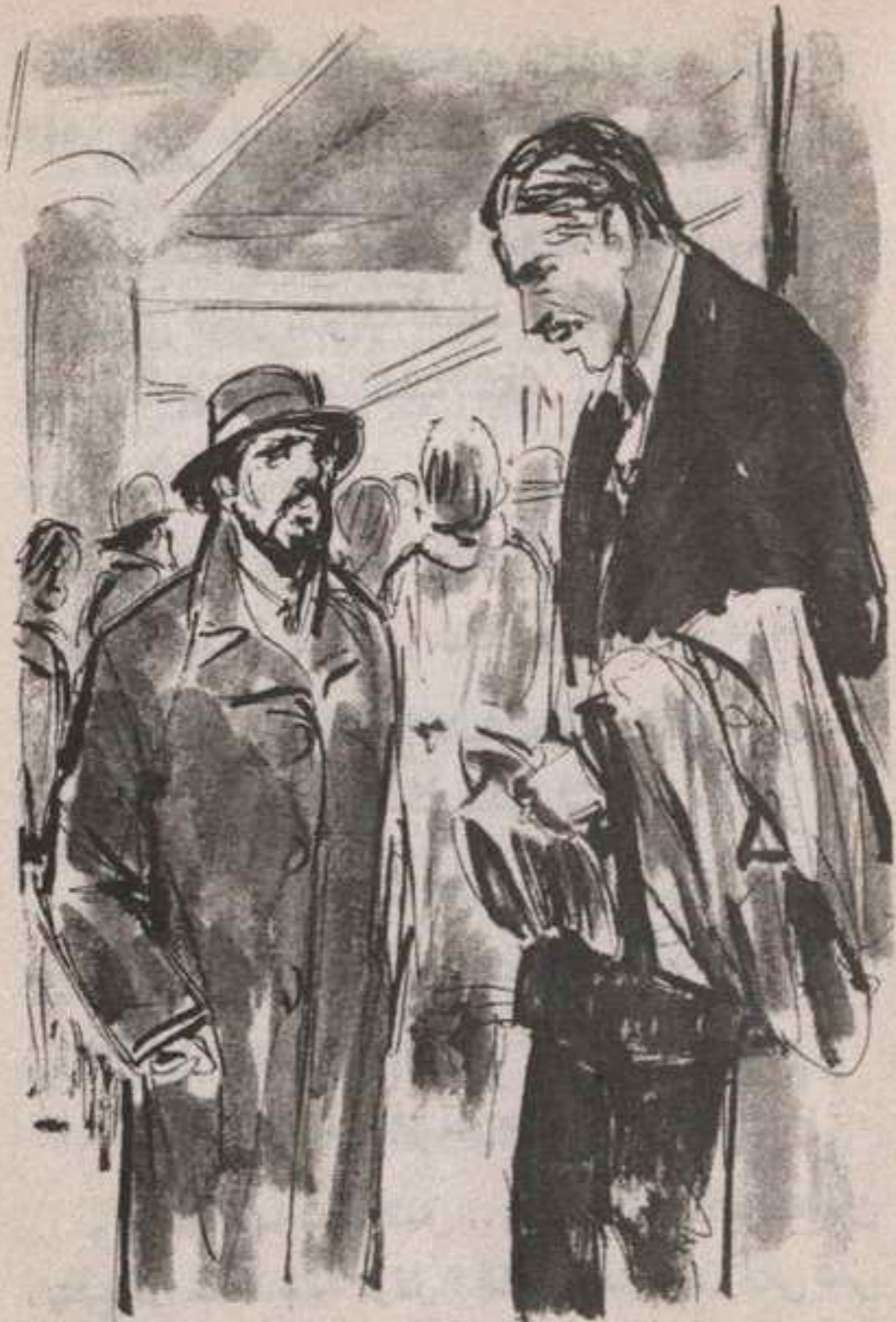
هزّ (ميسون) رأسه ، ولاحظ أن يدي الرجل لم تغادر جيبي معطفه ..

- « شكراً على العناية بصحتي .. والآن لنقل ماذا كنت تفعله ليلة الجريمة .. »