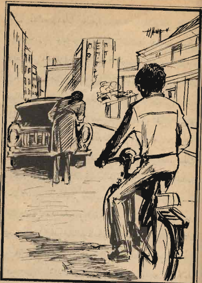
تخطى « ياسر » الرجل فى طريقه ولاحظ على الفور أنه ليس من أهالى المنطقة

وشغل هذا الرجل تفكير « ياسر » .. ترى لماذا يقف فى هذا المكان ؟ ولماذا يقوم بمراقبة منزل الأستاذ « خليل » ؟ وأوصله تفكيره إلى أن هذا الرجل لابد أن يكون على علاقة بأحداث الأمس .. ورجح أنه لابد أن يكون من رجال العصابة ، وأنه ما أتى إلى هذا