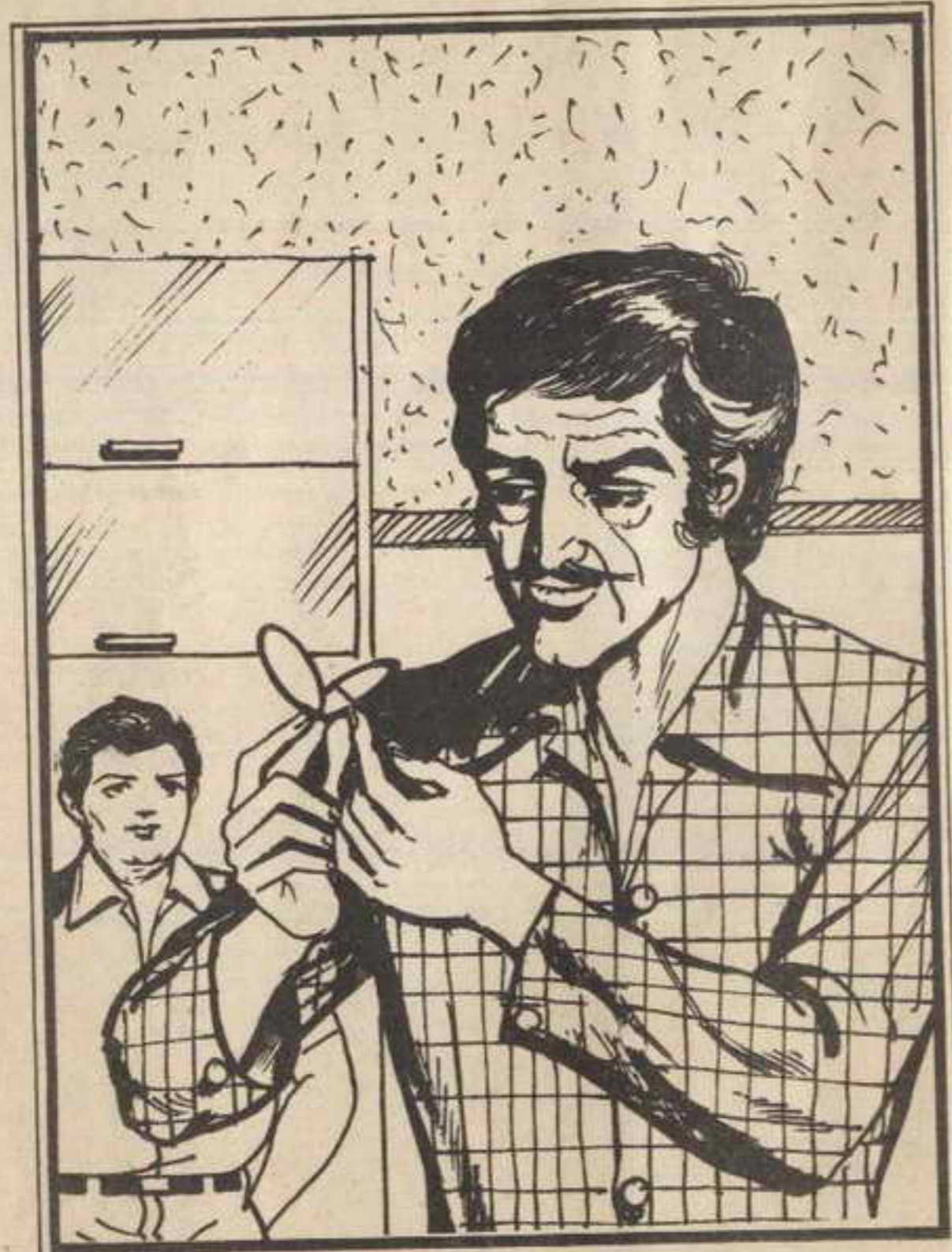
أمسك المهندس «على» بالقطعة وتأملها وأخرج أداة رفيعة دسها تحت الغطاء..