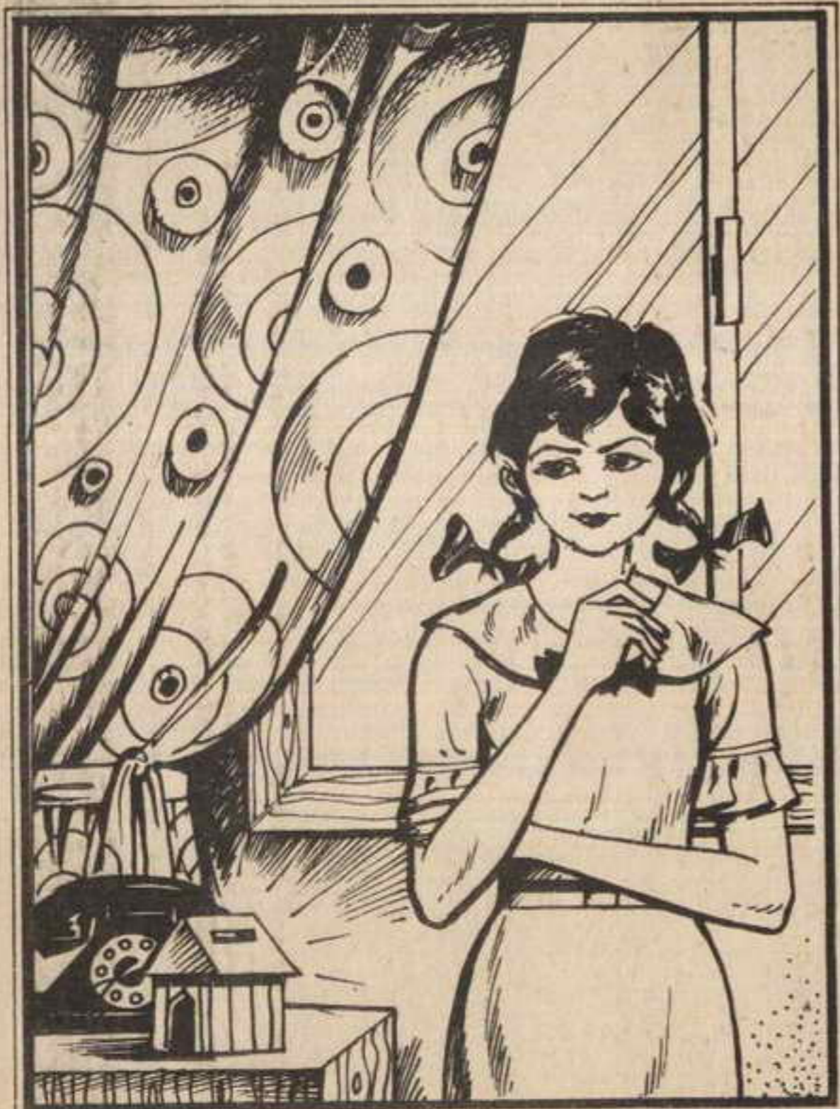
صاحبة «لوزة»: إنه نفس وصف الحصالة التي قال لي أصحاب المنزل إنها سرقت!

رنت كلمة «التليفون» في أذن «تختخ» رنينًا عجيبًا... «تليفون» لقد قال له المفتش «سامي» إن اللص يدخل البيوت الخالية من أصحابها دائما، ولم يخطئ مرة واحدة، وأفضل طريقة طبعًا هي الاتصال تليفونيًا، فإذا لم يرد أحد... كان هذا دليلًا على عدم وجود أصحاب البيت... ولكن ما دخل الحصالة بالموضوع؟