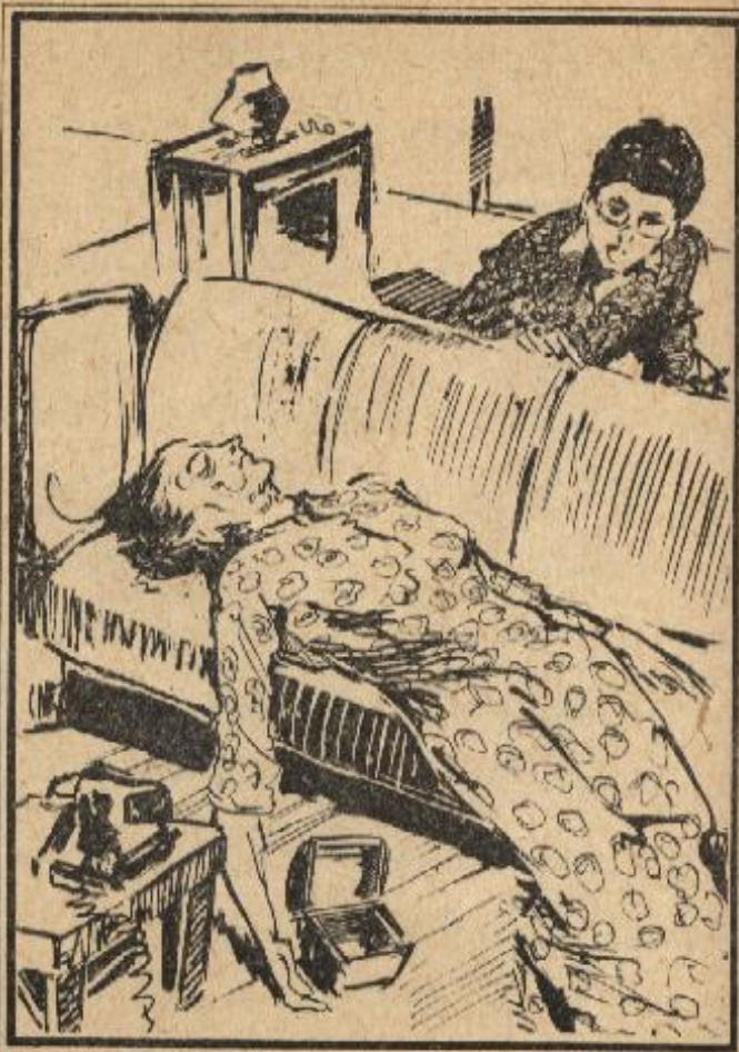
كانت السيدة العجوز في حالة إغماء وبيدها صندوق خال ومفتوح .

وفي ثوانٍ كان المفتش « حمدي » يجيب على « محسن » ، واستمع إلى القصة باختصار ، ثم طلب