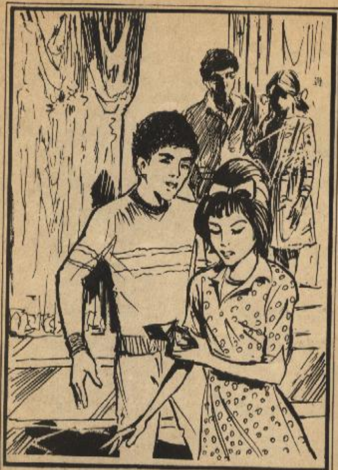
أمسكت «هادية» الظرف وقالت : سأجفئه لك في الحال .