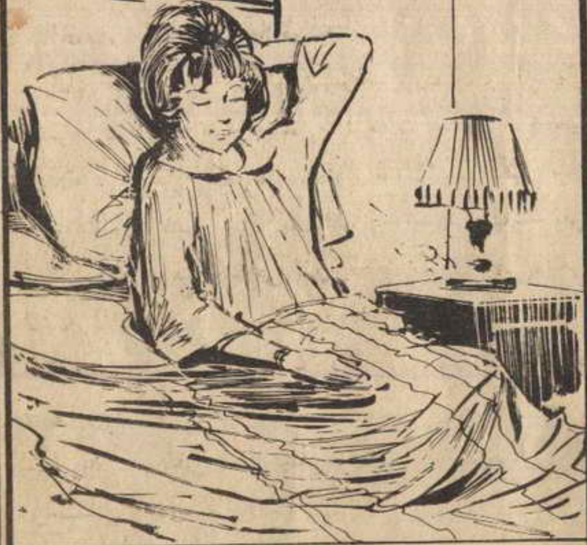
استلقت « فلفل » فوق سريرها تسترجع أحداث اليوم المشير ..

وتأتى أهم نقطة في اللغز ؛ وهي كيف استطاع اللصوص الخروج بالتاج من المعرض .. فإن خرج عن طريق