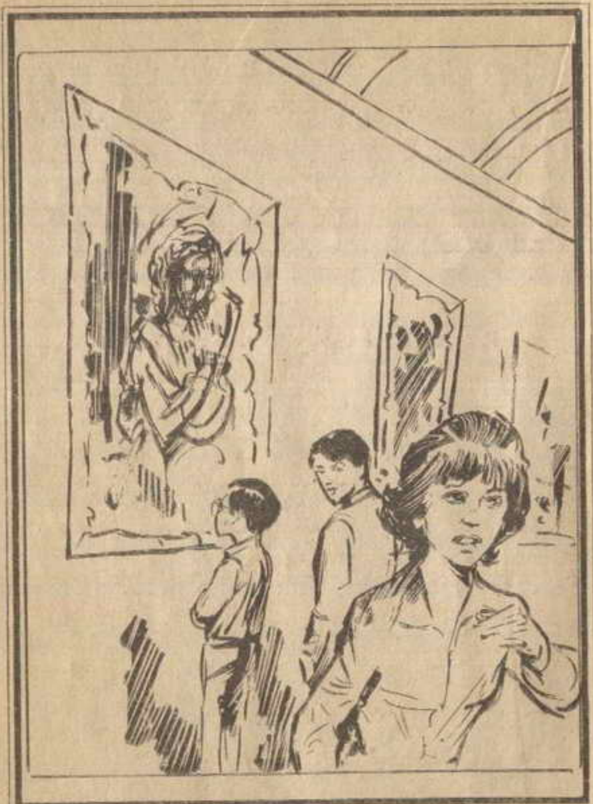
وفجأة تنبهت « فلفل » وقالت : أين مشيرة ؟

ويتأملونها بشدة .. وفجأة تنبهت « فلفل » وقالت : أين « مشيرة » ؟ وعلى الفور تنبه « خالد » و « طارق » ، وأخذوا ينظرون حولهم في دهشة ، فقد كانت « مشيرة » بجوارهم منذ لحظات .. قال « خالد » : ربما خرجت من القاعة لتشاهد غيرها .. ردت « فلفل » قائلة : ولكنها لم تخبرنا بذلك .. إنني قلقة عليها .. « طارق » : سنبحث عنها ، لا داعي للقلق فلا يمكن أن تكون ذهبت بعيدا .. « فلفل » : سنقسم أنفسنا في ثلاث جهات . سأبحث عنها في الطابق الأول ، وأنت يا « خالد » في الطابق الثاني ، و « طارق » في الطابق الثالث . وسنتقابل بعد ربع ساعة أمام باب هذه القاعة . خرج الثلاثة من القاعة ، فاتجه « خالد » للطابق الثاني ، و « طارق » للطابق الثالث ، وبقيت « فلفل » في الطابق الأرضي ..