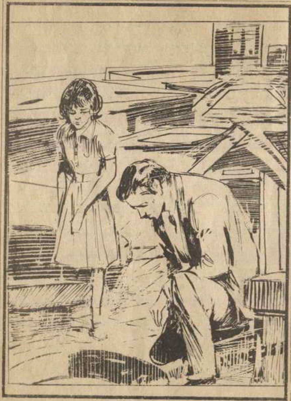
قالت « قفل » إذن فقد جاء اللص وصعد السلم الحديدية ..

خاصة وأنه يحمل معه التاج الذهبى .. ثم هبطا بواسطة السلم الحديدى ثانية وعادا إلى داخل المعرض . قال العقيد « محمد » مشيراً لأحد مساعديه : استدع الحراس المسئولين عن حراسة المعرض فى الليلة السابقة .. وبعد دقائق جاء الحراس الذين كان قد تم استدعاؤهم من منازلهم فور اكتشاف السرقة .. وجه العقيد « محمد » سؤاله الأول لمسئول الأمن فى المعرض قائلاً :