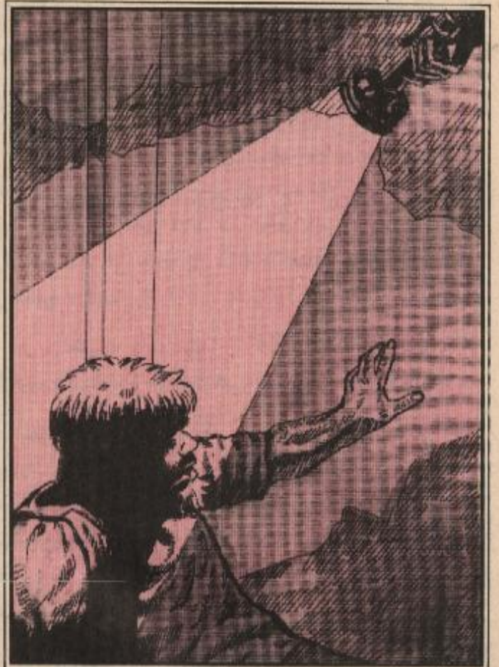
سلط عامر الضوء نحو المجنون .