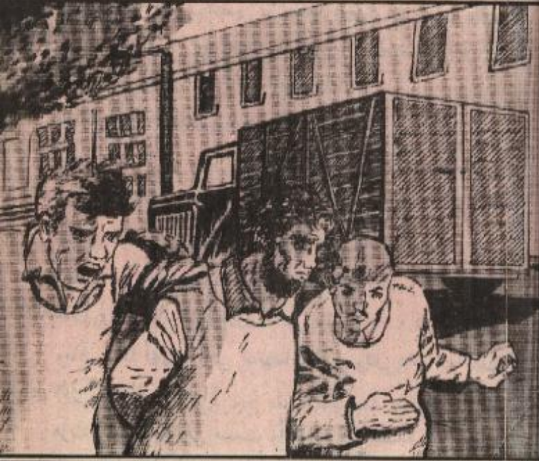
وفجأة توقفت عربة سوداء كبيرة ونزل منها رجلان وأخذوا أسعد المجنون وسط الدهاش عالية .

راح المجنون يصرخ بصورة هستيرية ويقول : لا . لن أذهب معكم . لا تعلبوني . لن أذهب معكم . لا أعرف أين هي . لأأخذ شيئا . حرام عليكم .