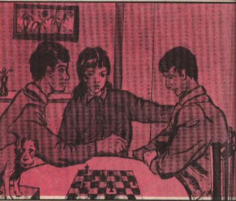
وجلس المغامرون يلعبون الشطرنج .

وبدأت المباراة الثالثة حماسية . وحرك عامر أحد البيادق للأمام وقبل عارف مثله ، ثم تحرك الوزير والحصان والقيبل ، وسارع عارف بحمي الملك بوضعه في أحد الأركان متبادلاً مكانه مع قطعة الطاوية .