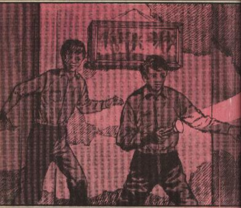
ودخل عامر وعارف إلى الطابية وقد أرقد عامر مصباحه الكهربائى

وبسرعة وجه عامر مصباحه لمصدر الصوت أسفل قدمه ، كان قد وطىء ذيل قطعة كانت نائمة فى ركن الصالة ، فرفع قدمه بسرعة عن ذيلها ثم سارع بالاختباء مع عارف داخل أقرب غرفة منهما .