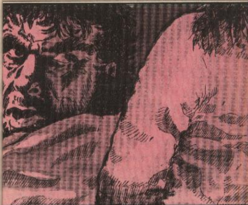
وفحاة رأّت عالية في الحديقة رجل مجنون يجلس بجوار الشجرة .

وفي دقائق انتهى الرجل من التهام كل ما أمامه ، ثم احتسى كوب الماء ومسح يديه في قميصه المتسخ الممزق وعاد إلى صمته