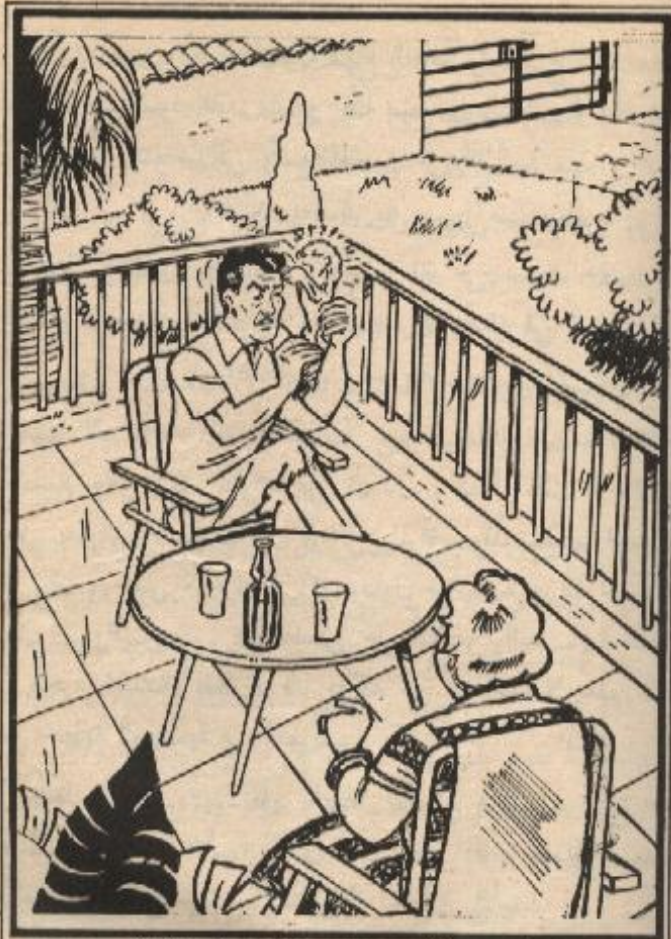
خرج ، عزيز ، ومدام ، كاتينا ، إلى الشرفة وجلسا على مائدة ، وأخذ ، عزيز ، يتأمل التمثال .

القماش وقد ضمتها إلى صدرها بشدة ، كما لو كانت تخشى أن يختطفها منها أحد فجأة .