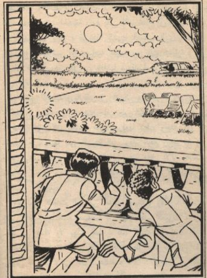
وأسرع الصديقان بالانبطاح أرضاً تفادياً للرصاص .

وفعل « هشام » ما طلبه « ياسر » ، وفتح باب الغرفة ، ولكن حدث في تلك اللحظة ما قلب الأمور رأساً على عقب ، فما كاد « ياسر » يستعد للقفز من فوق حاجز الشرفة حتى وجد أنه قد تأخر كثيراً ، ففي تلك الدقائق الثمينة ، التي اضطر فيها للرقاد على الأرض حتى يصل « هشام » إلى الباب خوفاً من رصاصات المجرم ، تمكن الرجال الثلاثة الذين كانوا يختفون في الظلام من القبض على الصبي « طارق رضوان » ، واصطحبوه معهم إلى السيارة .