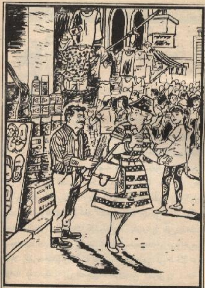
هالة ترقب مدام كاتينا فى شارع الحميدى .

ولاحظت « هالة » أن الرجل وضع يده فى جيبيه مرتين ، ثم أخرجها وخلع قبعته القلدة وجفف بها عرقه ، وعاد وارتداها مرة أخرى وهو ينظر إلى الرجل ذى القميص الأزرق فى النافذة ،