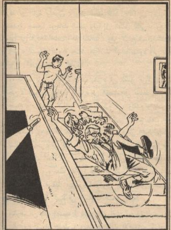
وتقدم . ياسر . من سور السلم . ودفع بتمثال مصنوع من الحجر ، فسقط التمثال متدحرجاً على درجات السلم وأخذ فى طريقه السيو « بترو » .

ونظر « ياسر » من ثقب الباب ، ورأى ما يحدث خلفه ، كان ما رآه شيئاً رهيباً لا يصدق ، لقد سرت فى جسده رعدة شديدة ، فقد كان « عزيز » يقف أمام « حسام » الذى شد وثاقه إلى مقعد خشبى ، بينما أمسكت مدام « كاتينا » بشمعة مشتعلة أخذت تقربها إلى قدمى « حسام » العاريتين ، والألم والعذاب يجعلانه يصدر هممة من حلقه تقطع القلب .