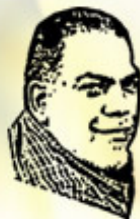
تان تانوي قديم