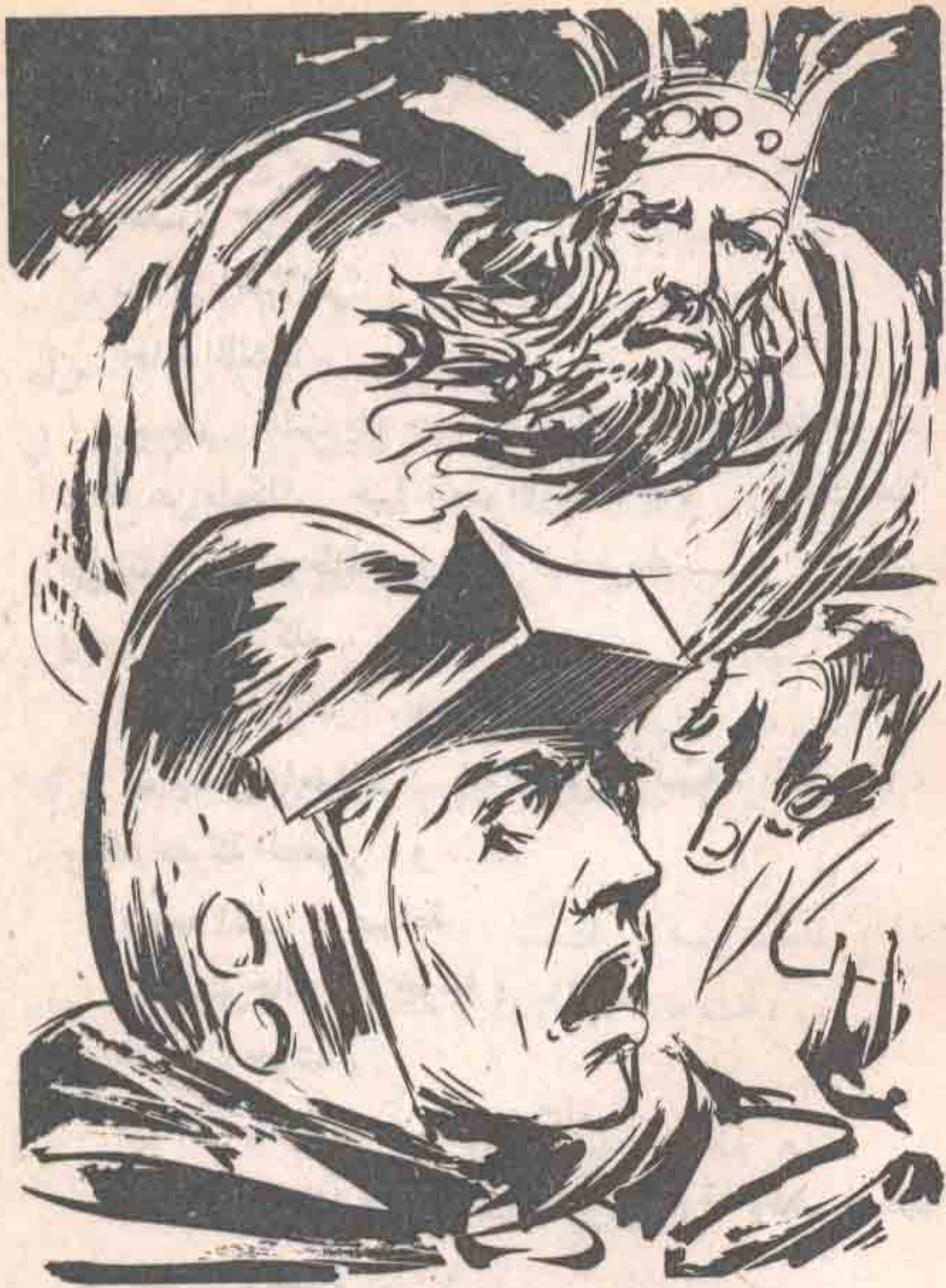
كان يقف أمامه تمامًا ملك (أدرিকা) الراحل ، الذي قتله (السوريت) ..