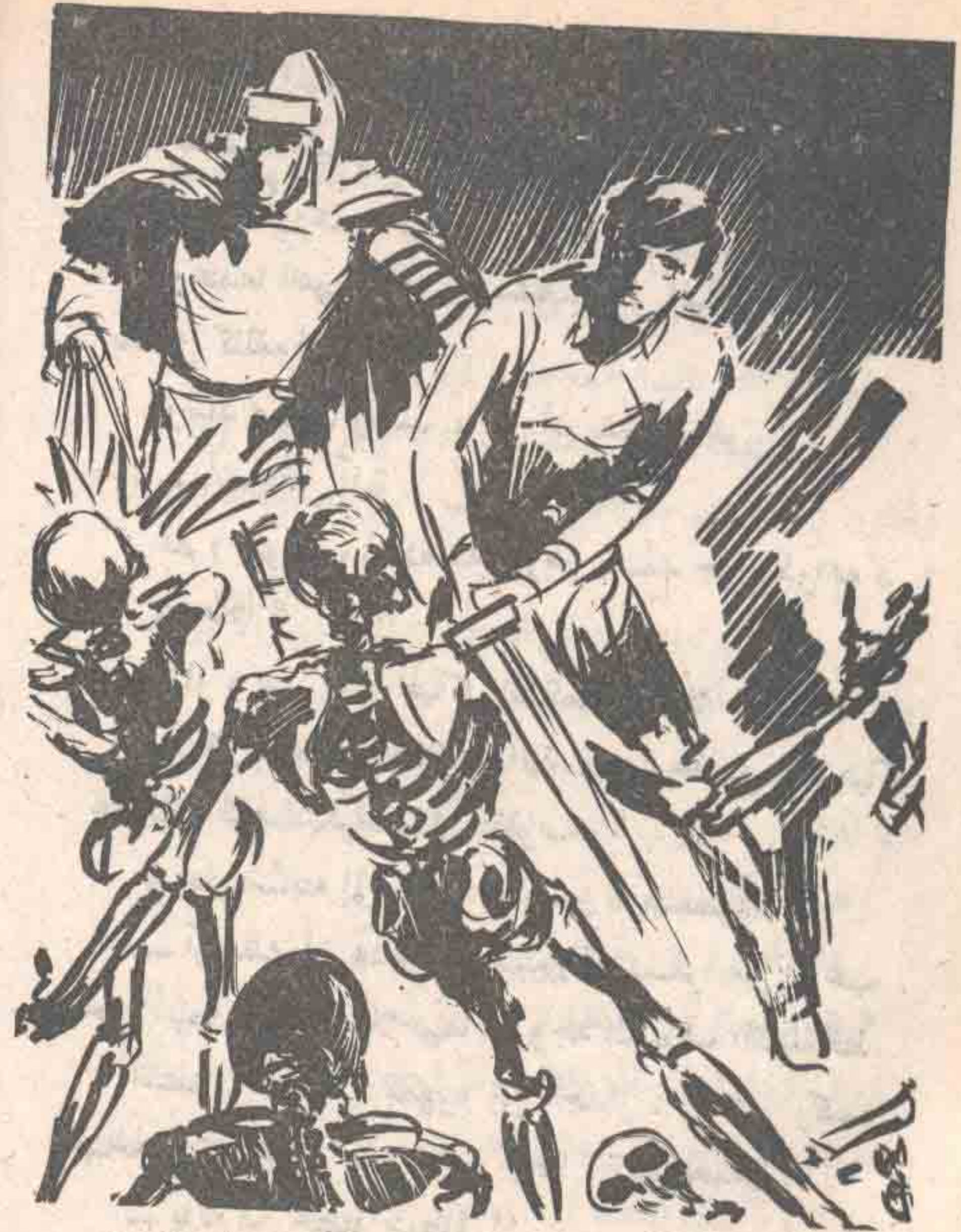
سقطت الهياكل العظمية واحدًا بعد الآخر ، إما بسيف ( نور ) البلوري ، أو بأشعة ( جوشا ) الزرقاء .

ثم تطلع إلى السيف ، وابتسم ابتسامة باهتة ، وهو يستطرد :