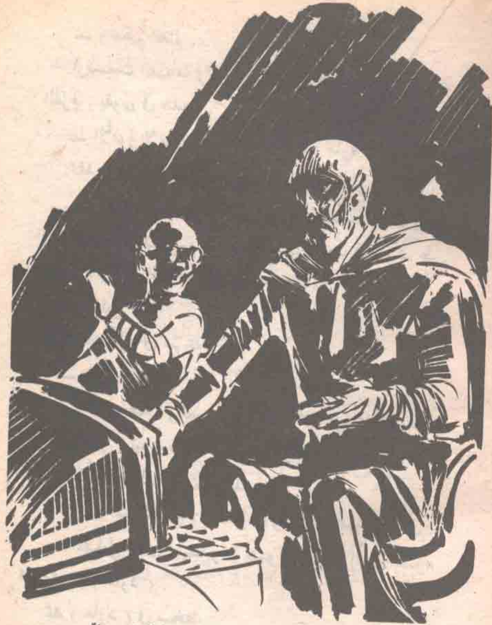
جلس ( أمير الظلام ) النحيل في حجرته المظلمة ، يراقب شاشة راصدة في اهتمام بالغ ..