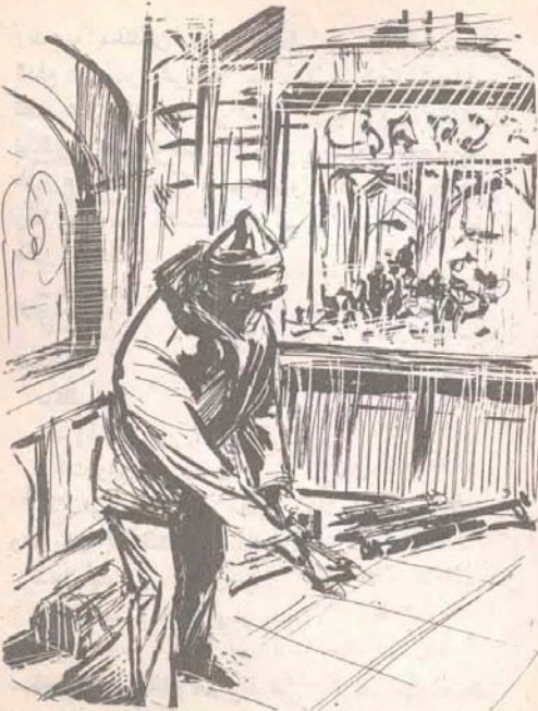
لقد تصرف كمحترف حقيقي ، فالقي البندقية خلفه ، وخلع قفازيه ، وهو يعدو نحو مدخل السطح ..

وهنا يحين موعد الطلقة الثانية .. ولقد انطلقت في موعدها بالضبط .. بعد ثانية واحدة من الرصاصة الأولى .. ويعد أن حدّد القاتل المحترف هدفه بدقة .. وقبل أن يندفع ( باردو ) نحو ( ستاسي ) الحقيقي ، ويحاول دفعه بعيدًا ، أو حتى حمايته بجسده ، اختزقت الرصاصة الثانية الجدار الزجاجي ، وعبرته لتستقر في منتصف جبهة السياسي الأمريكي مباشرة .. وصرخ المفتش في هلع غاضب :