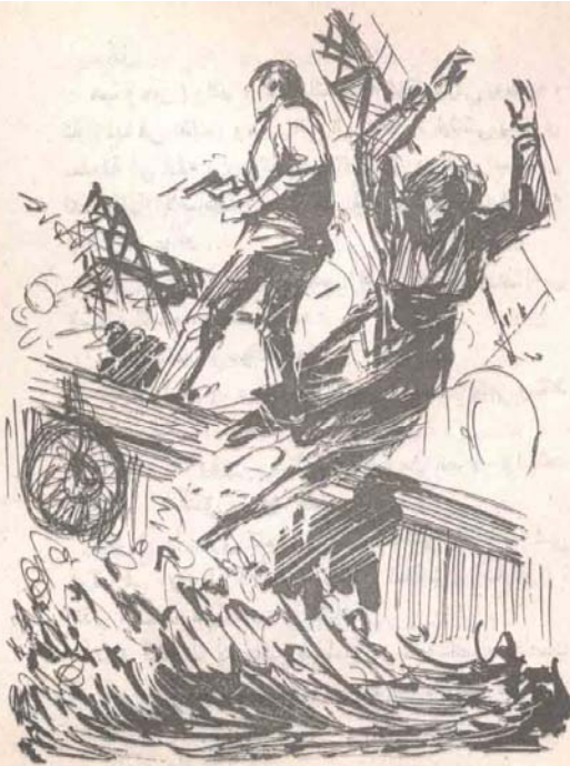
فدفع ( نينا ) جانبا ، وهو يهتف :