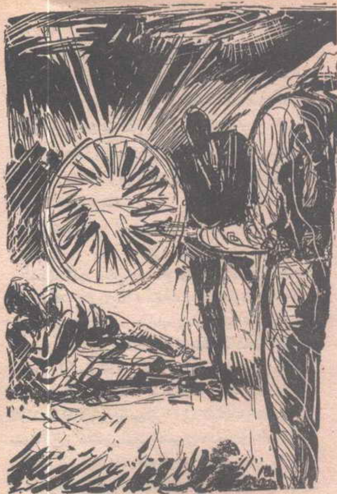
وأمام العيون الداهلة المدهشة ، لم يتجاوز الانفجار حدود

لم يعلق على دهشتها ، وهو يراقب الآلي ، الذي أطلق الكائنان نحوه شعاعا عريضا أزرق اللون ، لم يكد يحيط به ، حتى تألقت في جسده بقعة زرقاء ، تتحرك