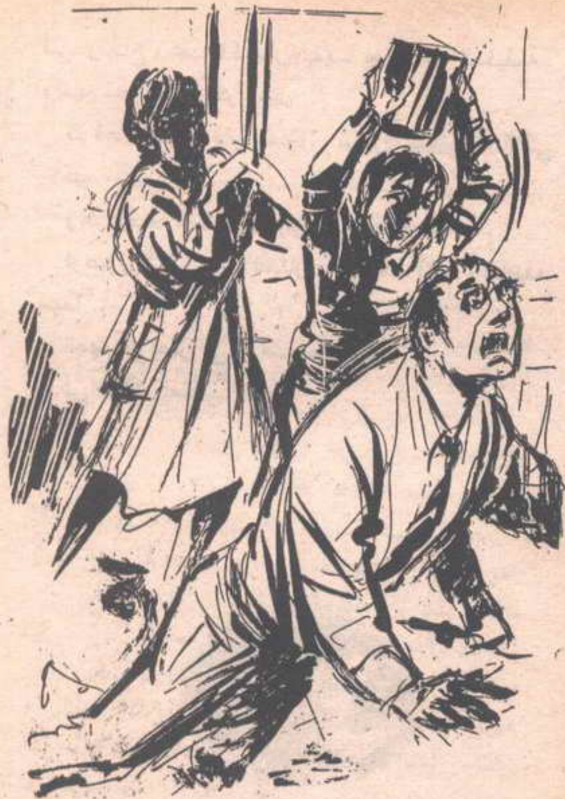
لم يكذ يطلق صرخته هذه ، حتى هوى ابنه بالعبة المبطنة بالرصاص مرة ثانية على رأسه مباشرة ..

واتسعت عينا (نادرة) في ارتياح ، عندما شاهدت تلك القوة ، التي طوّح بها ابنها بالعبة الثقيلة ، ورأتها ترتطم بأنف زوجها ، وتحطمه في عنف ، فتفجّر منها الدماء في غزارة ، ولكن قبضته تظلّ متشبّثة بقدم ابنه في استماتة ، وهو يصرخ :