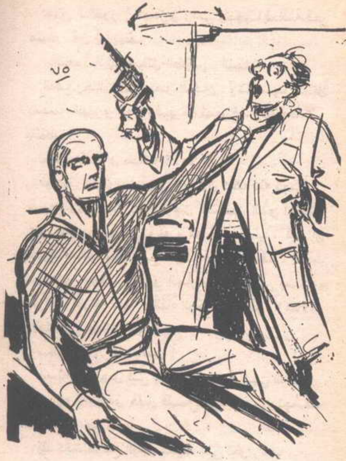
وفجأة انقضت اليد الباردة كالثلج على عنق الطبيب ، وقبضت عليه في قوة ..

وفجأة ، انقضت اليد الباردة كالثلج على عنق الطبيب ، وقبضت عليه في قوة ، شهق لها هذا الأخير ، قبل أن يصرخ في رعب ، بصوت مختنق مبجوح : - النجدة .. النجدة .