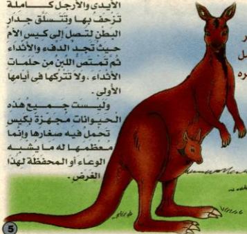
كنغر يحمل صغيره

وهي بذلك تعد وسطاً بين الثدييات البيوض، والثدييات المشيمية المعروفة. ويقتصر وجود الكيسيات على أستراليا والمناطق المحيطة بها، عدا بعض الأنواع القليلة توجد في أمريكا.