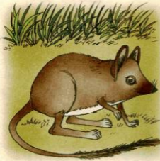
فأر كيسي نطاط

وتولد الصغار وفيها الأيدي والأرجل كاملة ترحف بها وتتسلق جدار البطن لتصل إلى كيس الأم حيث تجد الدفء والأنداء ثم تمتص اللبن من حلمات الأنداء، ولا تتركها في أيامها الأولى.