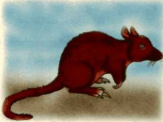
فأر كنغر رماح

لعائلة الكنغر أنواع كثيرة وليس فقط النوع المشهور. وتوجد هذه العائلة في أستراليا والمناطق المحيطة بها.